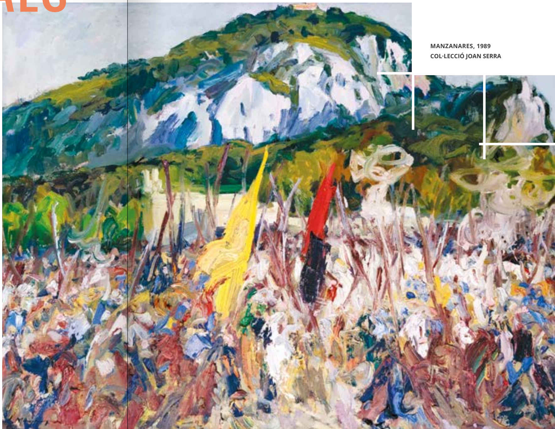
MANZANARES, 1989 COL·LECCIÓ JOAN SERRA

Clar que llavors el llenç en què es convertia el cos humà s'embutumava únicament amb blanc i negre, reconvertint els pacífics menestrals i pagesos en ferotges corsaris. Amb el pas del temps, la carbonissa dels suros cremats fou substituïda per tota l'escala cromàtica de les col·leccions de barres i tubs de pintura que, ara sí, la balquena dels anys seixanta posava a l'abast de les butxaques de (quasi) tothom. L'art de la performance s'ha individualitzat i ha adoptat la doctrina "Sintax": cada un es pinta a la seva manera. O això és el que ens pensam. Perquè el fragor -i la calor- del combat fan la resta. Fusiona cossos i colors. Barreja olors, sucs, suor i pintura. La psicodèlia inicial es converteix en un quadre postimpressionista, digne d'un Anglada o un Tito. Encara que el qualificatiu d'expressionista també li seria adient.