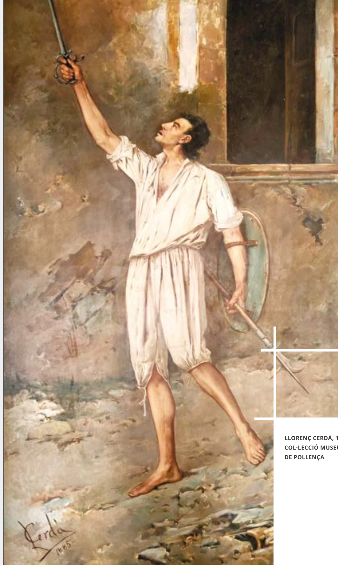
LLORENÇ CERDÀ, 1885 COL·LECCIÓ MUSEU DE POLLENÇA